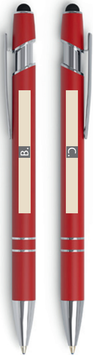
Motivbereich auf Produkt